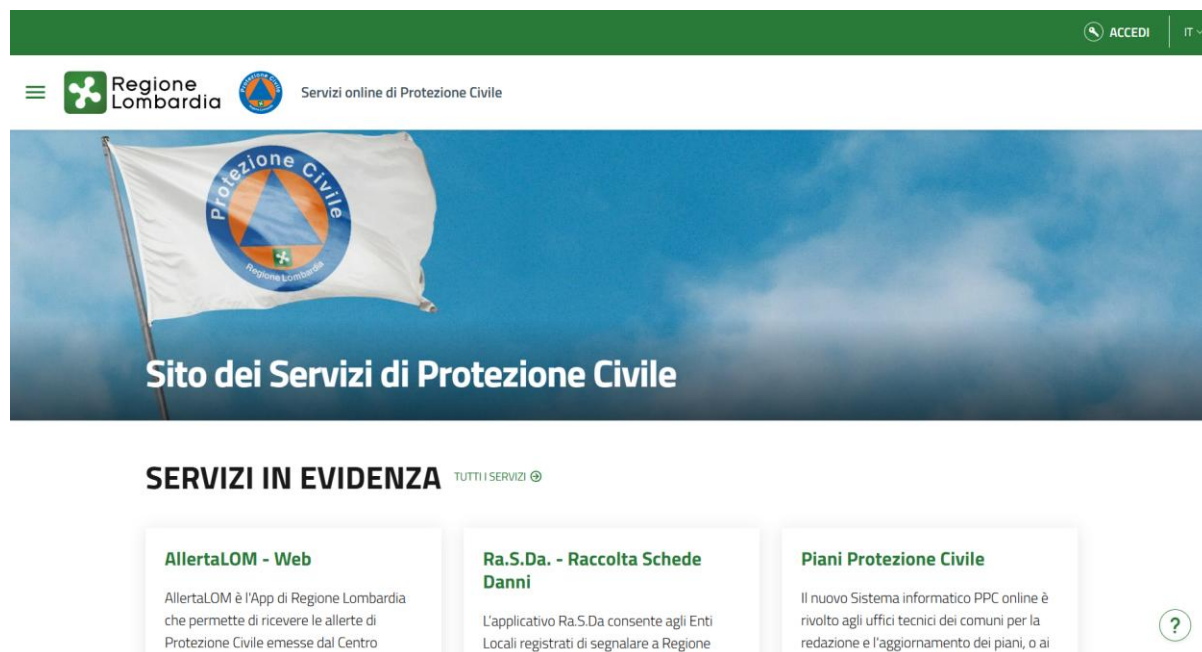
Figura 1: Home page del Sito dei Servizi di Protezione Civile.

L'accesso al sistema avviene tramite l'accreditamento sul portale dei Servizi della Protezione Civile di Regione Lombardia, disponibile all'indirizzo: https://www.protezionecivile.servizirl.it .